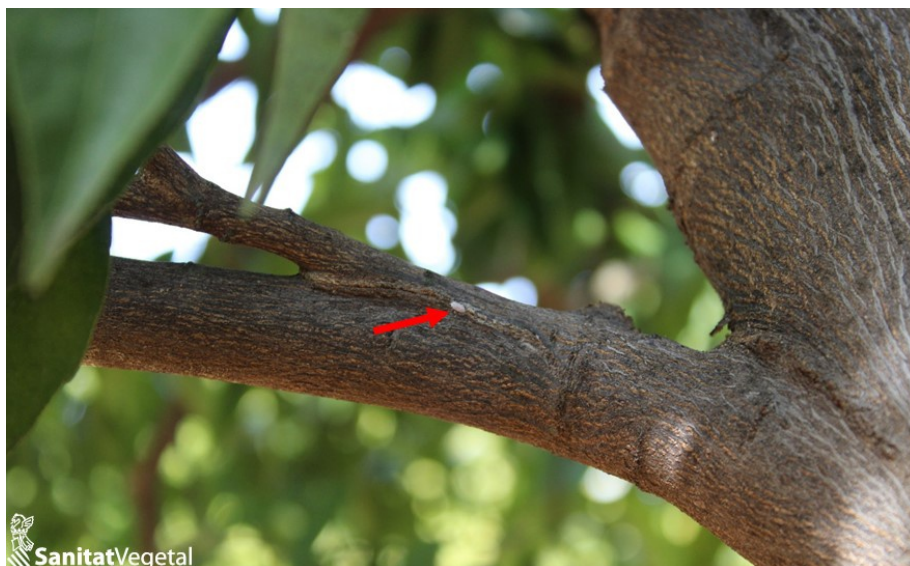
Hembras de cotonet de Sudáfrica en rama principal