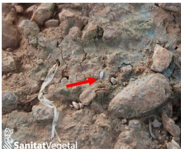
Hembras de cotonet de Sudáfrica en el suelo al lado del tronco

Al elegir un formulado de cualquiera de estas materias activas se prestará especial atención a los usos y dosis autorizadas, así como a las condiciones de uso y manipulación.